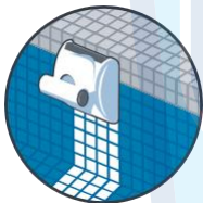
Καθαρισμός της ίσαλο γραμμής

Ασύρματο τηλεχειριστήριο για πλοήγηση αφής στις επιλογές χρόνου κύκλου λειτουργίας